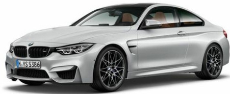
Abbildung zeigt gewählte Ausstattung. Irrtümer und Änderungen vorbehalten.